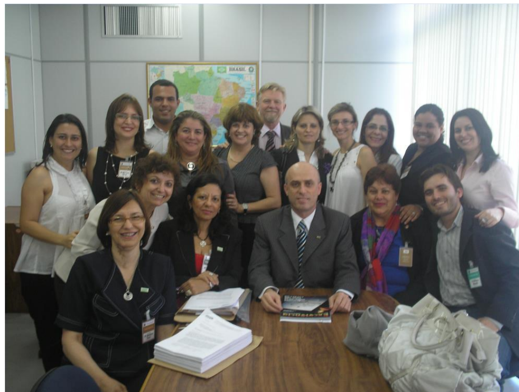
Foto: Reunião em Brasília, no dia 15 de outubro de 2009, na Secretaria da Educação Superior SESu/MEC.

2009 Realização da consulta pública que a Secretaria de Educação Superior do Ministério de Educação (SESu/MEC).